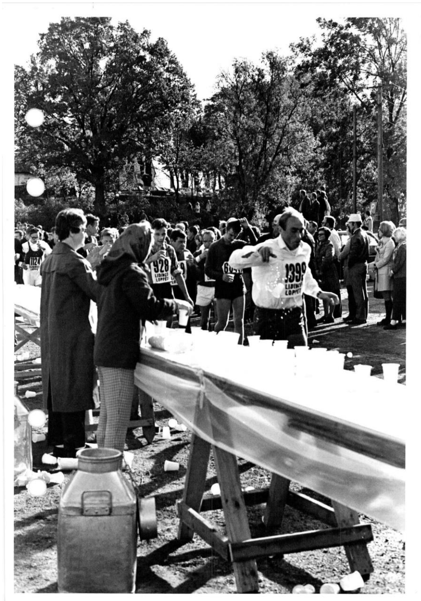
Så här såg vätskedepån nedanför Lidingö kyrka ut 1967, det var då Ladies Cup och Gubbpokalen debuterade som funktionärer i Lidingöloppet. Lägga märke till mjölkflaskan, vilken innehöll vatten: