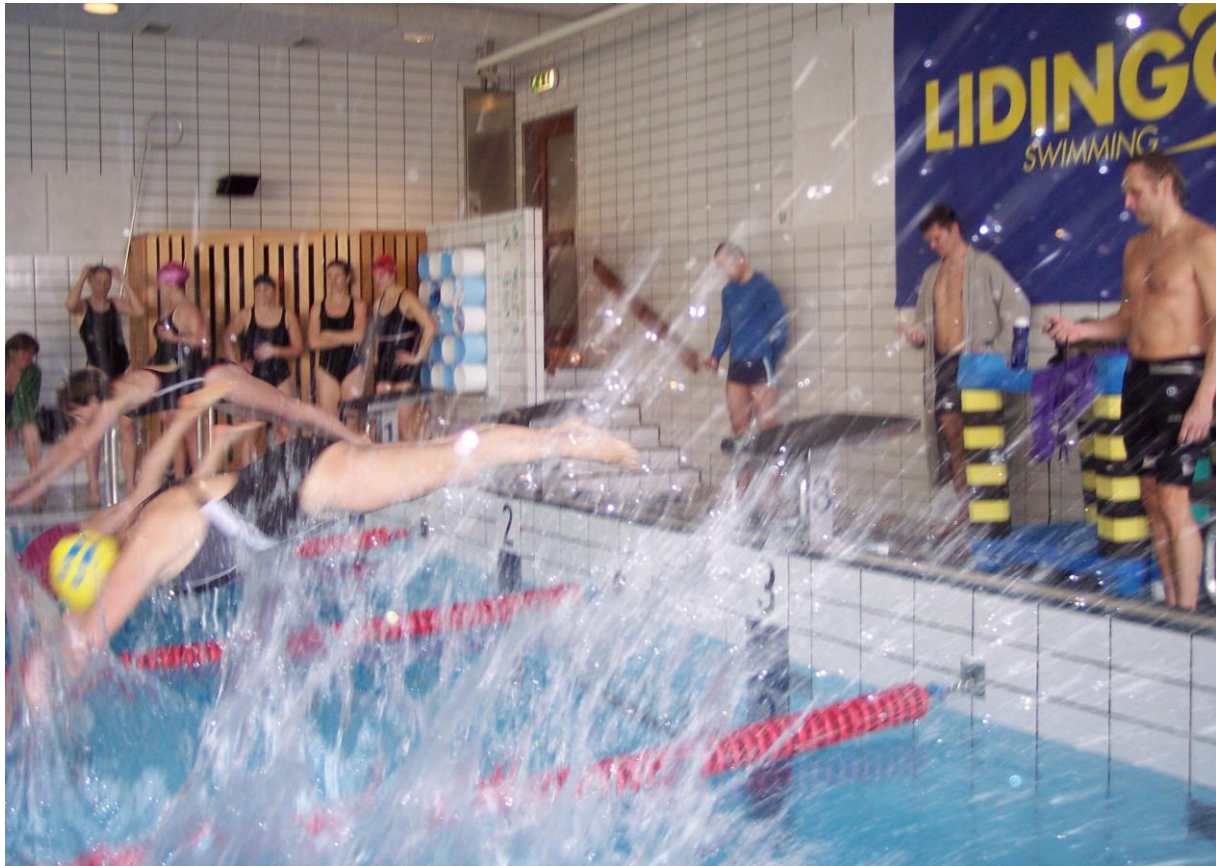
Start Ladies Äldre 50 frisim Gångsätra 2015