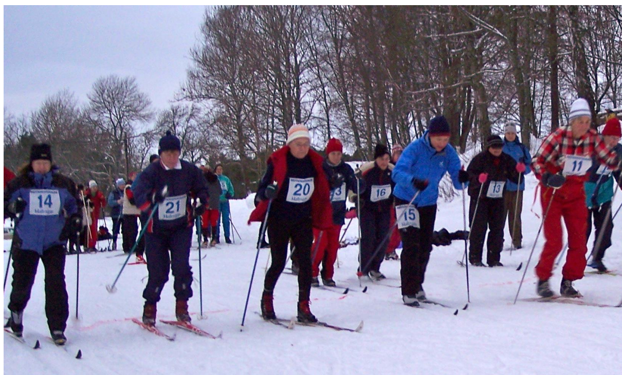
Starten Ladies Äldre 2010 nedanför Motionsgården Stockby

tävlingarna är i ordning: Skidor, skridsko, simning, bowling, terränglöpning, skytte, varpa, kulstötning (ej för de tre äldsta ladiesklasserna) orientering, bordtennis och badminton. Nedan följer en presentation av grenarna.