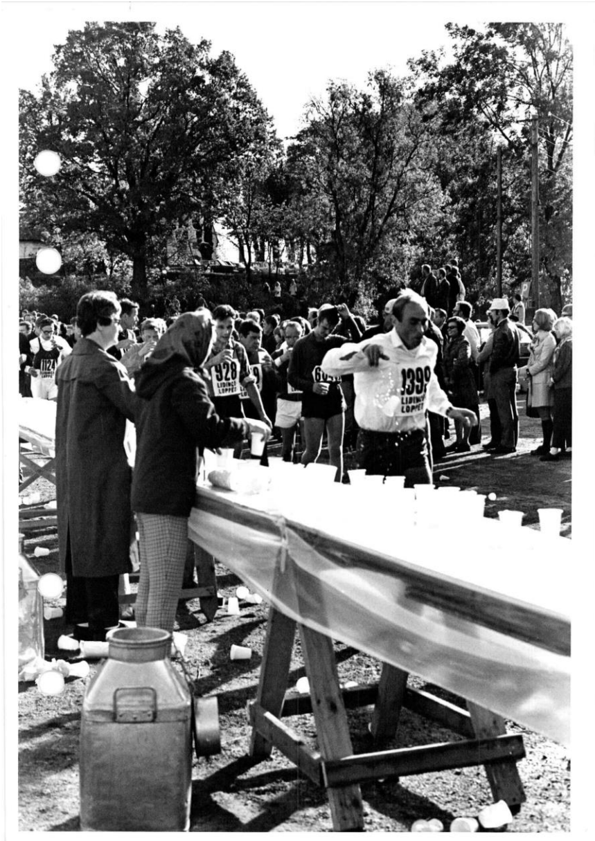
Så här såg vätskedepån nedanför Lidingö kyrka ut 1967, det var då Gubbpokalen med damer debuterade som funktionärer i Lidingöloppet, året innan Ladies kom med i Motionspokalen. Lägg märke till mjölkflaskan, vilken innehöll vatten: Foto Lidingöloppets arkiv.