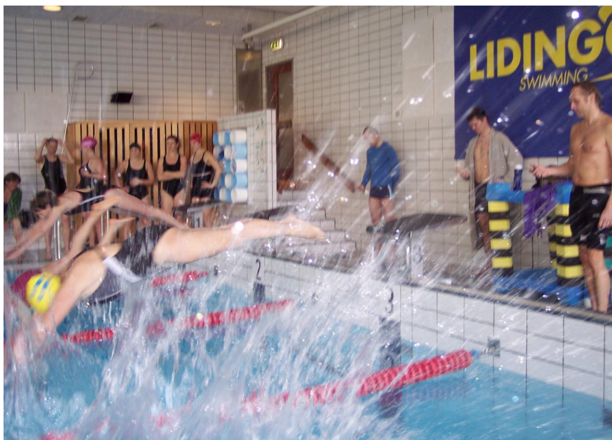
Start Ladies Äldre 50 frisim Gångsätra 2015